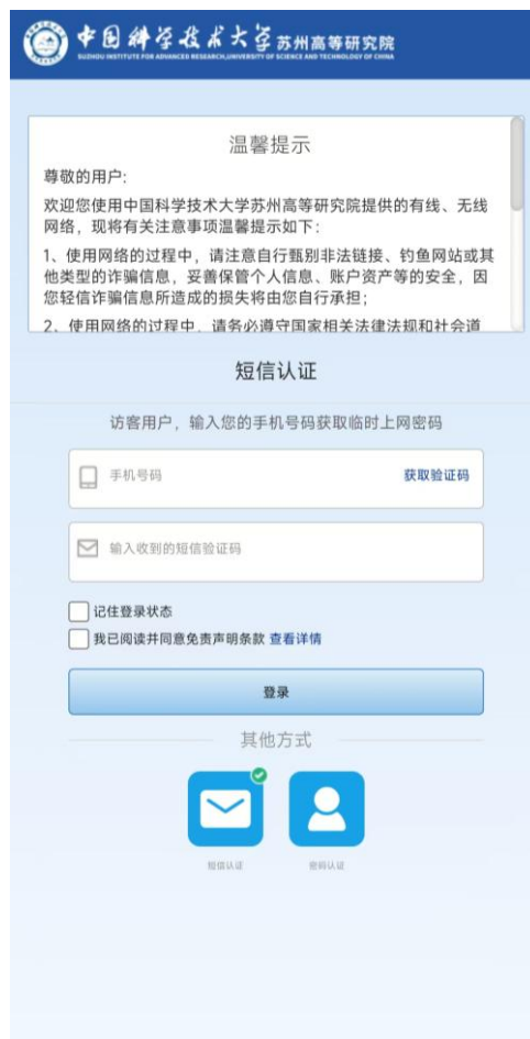
短信验证码输入界面