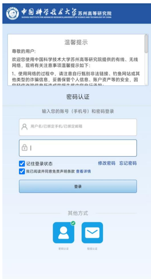
网络准入认证系统登录界面